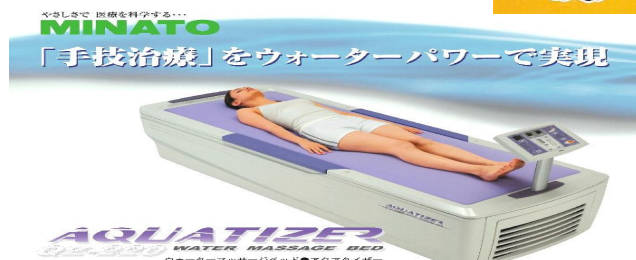
ウォーターマッサージベッド